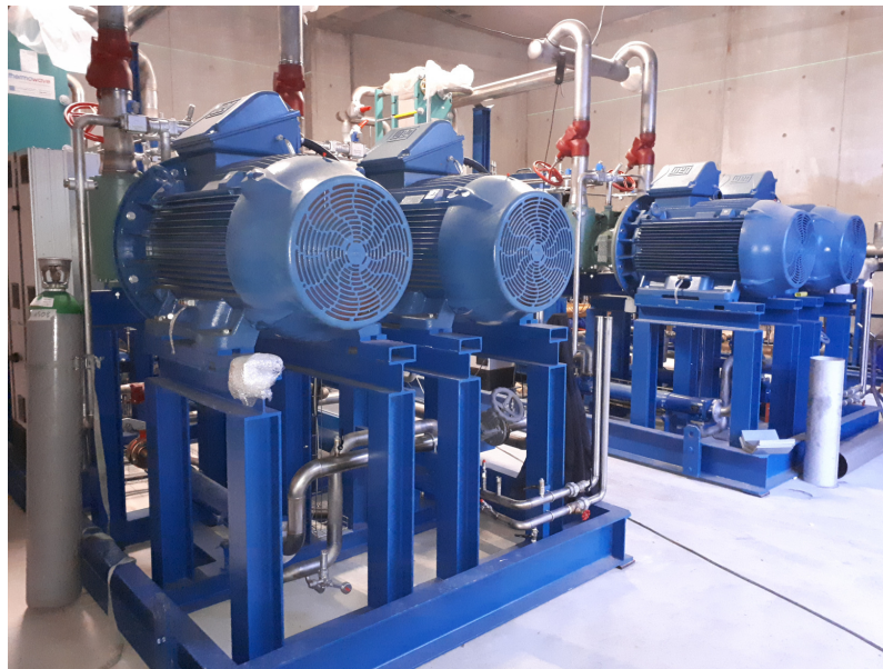
Salle des Energies

Cette nouvelle installation associant la production de froid à la production d'eau chaude génère de remarquables économies d'énergie. MerAlliance a donc décidé de s'engager durablement dès début 2021 auprès de l'Etat via un Contrat de Performance Energétique (C.P.E.). L'entreprise constitue avec certains de ses fournisseurs un Comité de Pilotage Energétique qui, au travers de revues énergétiques annuelles, contrôlera la tenue de ses engagements de performances énergétiques pendant les 5 prochaines années.